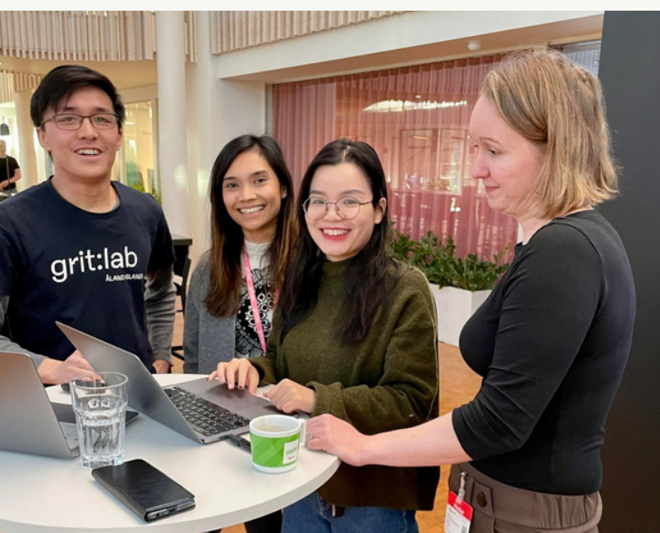
Presentation hos Grit:Lab 20 januari 2023.

Majoriteten av lotsstödet till organisationer bedrivs i dagsläget genom e-post och telefon, vilket dels kan förklaras av att arbetssätten ändrades under pandemin, dels för att lotsfunktionen ständigt blir mer etablerad. Behovet att träffas uppstår främst om många inom organisationen vill ha information eller stöd samtidigt, om lotsfunktionen sammanför flera organisationer för samverkan eller om personen som tar kontakt inte tidigare har haft kontakt med lotsfunktionen. Utöver angett har således lotsfunktionen stöttat i ett 80-tal ärenden per e-post eller korta sittningar. Lotsstöd över telefon dokumenteras inte, men är i betydande minoritet jämfört med stöd som erhålls genom e-post.