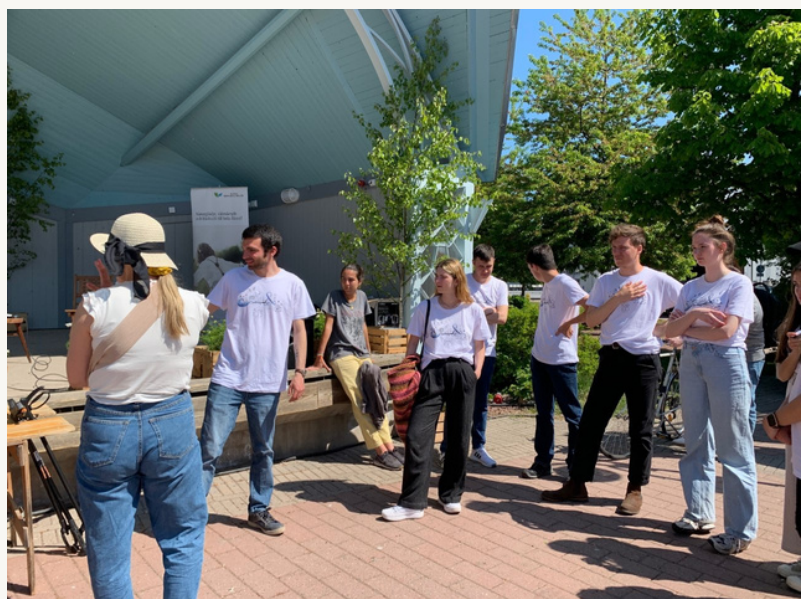
Åland 100 Clean Up 2-16 juni 2022.

Medarrangör för lunchseminarium den 19 oktober 2022 med ÅSUB och Nordregio.